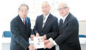
▲福祉バザー実行委員会