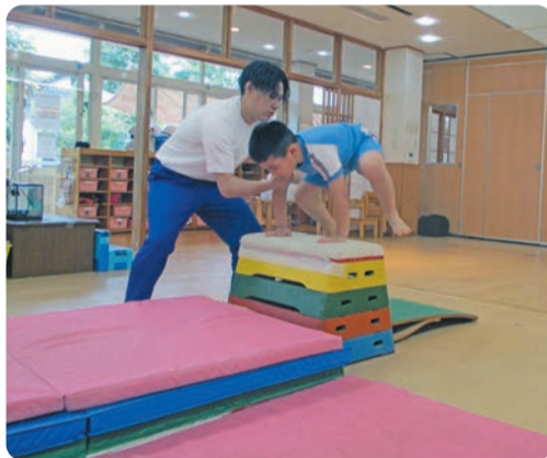
募金実績額の65%が障がい者施設や児童福祉施設で利用者のために役立てられます。

あきる野市内の希望する福祉施設に、利用者のための備品や設備整備の資金の一部として各施設に配分されます。