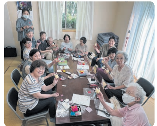
住民相互の支えあい活動を推進するために、活用されています。

本会が実施するふれあい福祉委員会やふれあいサロン、ボランティア活動を支援する取組のために活用されます。