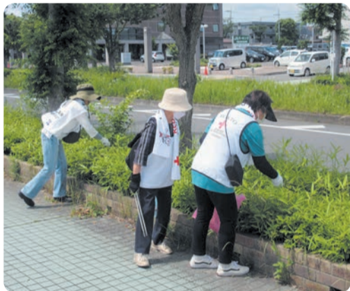
あきる野市赤十字奉仕団が行う、地域の防災・減災などの取組にも活用されています。

災害時の医療救護活動や救援物資の配布、救急法等の講習、地域や子ども達への防災教育などに活用されます。