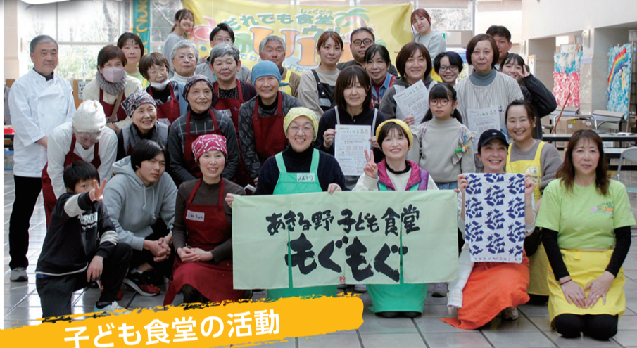
子ども食堂の活動