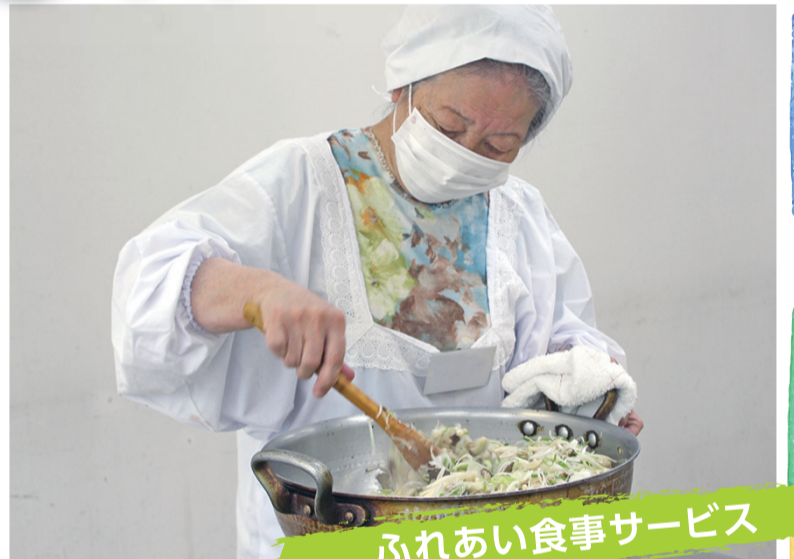
ふれあい食事サービス