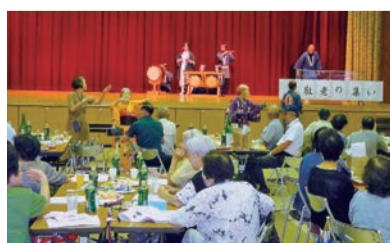
▲敬老の集いの様子

自治会としては「強靱な共助」につなげるため、様々な活動を通し、地域の方々の交流を深め、安心して住みやすい自治会にしていきたいと考えています。