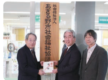
福祉バザー実行委員会