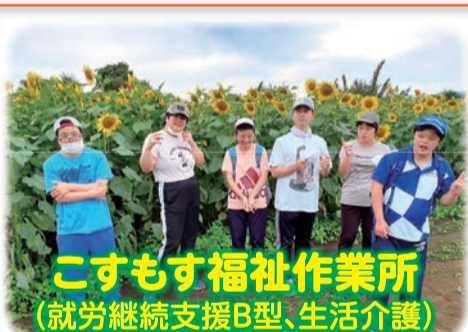
こすもす福祉作業所 (就労継続支援B型、生活介護)

本会では、障がいを持つ方が自宅等から通える事業所を、秋川地区(秋川ふれあいセンター内)に2か所(こすもす福祉作業所・ひばり分室)、五日市地区に1か所(希望の家)運営しています。利用者が毎日楽しく生活できる場所を目指し、日々取り組んでいます。利用や見学を希望される方は、各事業所へ気軽にお問い合わせください。