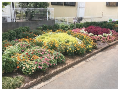
▲令和4年度受賞した時の花壇

今後も、町内会のあるべき姿である住民相互が支え合い、助け合える町内会を目指していきます。