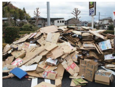
▲資源回収で集まった段ボール