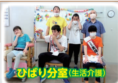
ひばり分室(生活介護)

「明るく・楽しく・仲良く」をモットーに利用者に創作や生産活動の機会を提供し、身体機能及び生活能力向上に必要な支援を行っています。主な活動は歩行訓練と創作活動です。 ☎595-2324