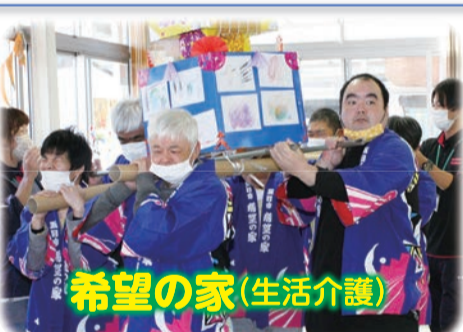
希望の家(生活介護)

働く機会の提供や日常の必要な支援を行う多機能型の事業所です。健康維持を目的とした歩行や創作的な活動を取り入れ、利用者が充実した1日を送れるよう支援しています。 ☎558-2566