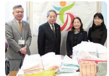
あきる野商工会女性部