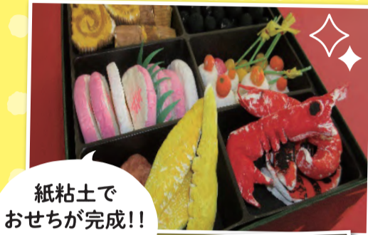
紙粘土で おせちが完成!! おいしそう!