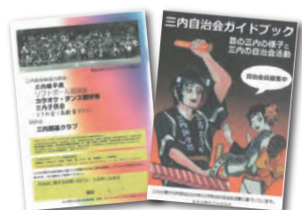
▲三内自治会ガイドブック

災害時に住民同士が協力し合える体制を作ることも自治会としての重要な役割であると考えていますので、これからは安心・安全・親睦を基本に、自治会活動に取り組んでいきたいと思っております。