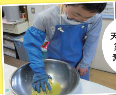
天然の塗料で 染めました! 素敵でしょ!!