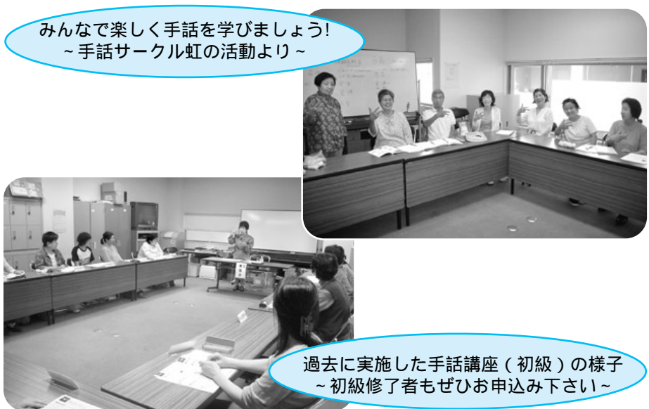
みんなで楽しく手話を学びましょう! ~手話サークル虹の活動より~

ボランティア活動を続ける意思のある方を過去に、手話技術に関する講座・研修を受けた経験のある方(回数・内容等はいりません) 8回以上参加可能な方 定員 20名(申込み順) 参加費 2500円 申込み・問合せ 社協秋川事務所市民活動推進係 595-9033