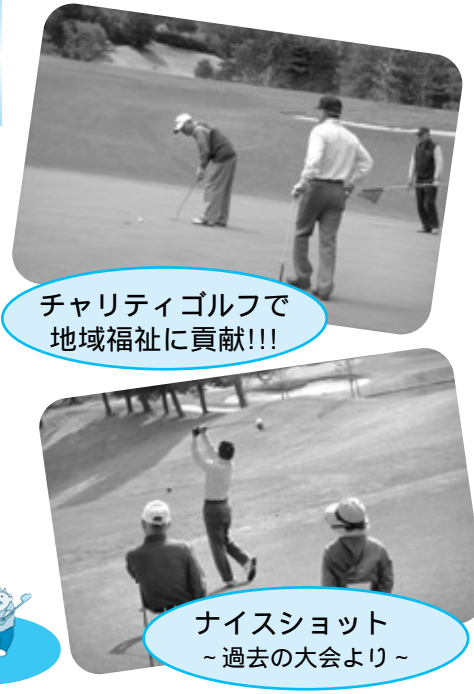
チャリティゴルフで 地域福祉に貢献!!!

主催 あきる野市民チャリティゴルフ大会実行委員会 主管 あきる野市社会福祉協議会 協賛 東京五日市カントリー倶楽部 あきる野とうきゅう、(株)東京サマーランド 申込み・問合せ あきる野市民チャリティゴルフ大会実行委員会事務局 ・秋川事務所(秋川ふれあいセンター) 595-9033(直通) ・五日市事務所(市役所五日市出張所内) 595-0818 受付時間 平日午前8時30分から午後5時15分まで(土日祝日を除く)