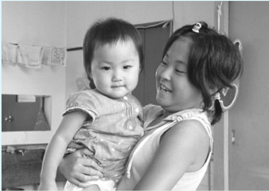
初めて赤ちゃんを抱っこさせてもらいました。とても可愛かったです。

小学生から社会人まで 昨年度は、延べ440名の方が活動に参加されました。ボランティア初心者も経験者も、小学生以上であればどなたでも申し込み可能です。ぜひ勇気を出してチャレンジしてみてください。新しい発見があるかもしれませんよ！