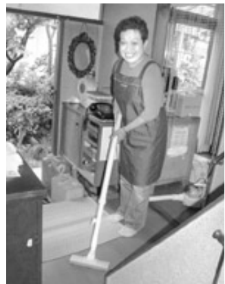
さあ、掃除しますよ!

このご夫婦には子どもさんもなく、気軽に頼めるご近所の方もありませんでした。早速、活動に入る協力員を探しましたが、