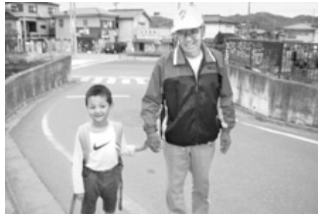
学園のバスから児童センターまで一緒に

「困っている時はお互い様」の日本人の文化を象徴するような社協の助け合い事業が、『有償家事援助サービス事業』です。活動内容は掃除、洗濯、家事全般等困っている市民からの要望に協力員が対応し、そのお礼として1時間700円をお支払いたしますというものです。