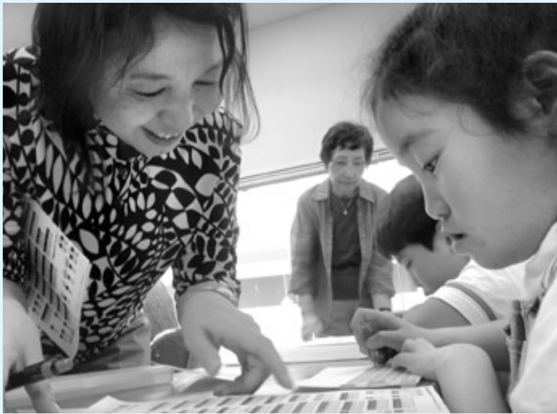
昨年、秋川ふれあいセンターで開催された夏！体験ボランティアの点字教室。講師は点字サークル「まど」の皆さん。

〒197-0812 東京都あきる野市平沢175-4 秋川ふれあいセンター内 TEL 042-559-6711 FAX 042-559-3561