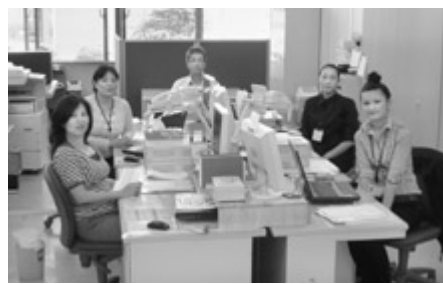
4月よりスタートした地域包括支援センター事業「五日市はつらつセンター」

平成20年4月からの社協新規事業として、あきる野市からの委託事業である地域包括支援センター事業「五日市はつらつセンター」と東京都社会福祉協議会からの委託事業である「基幹型地域福祉権利擁護事業」を開始しました。両事業とも、市役所五日市出張所の五日市はつらつセンターで行っています。