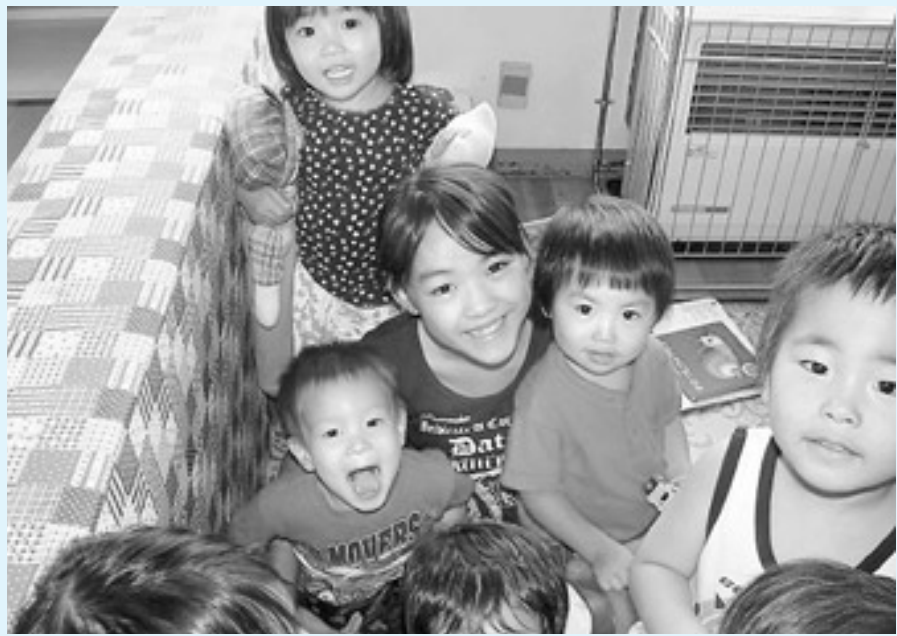
笑顔で集合写真 ~草花保育園より~