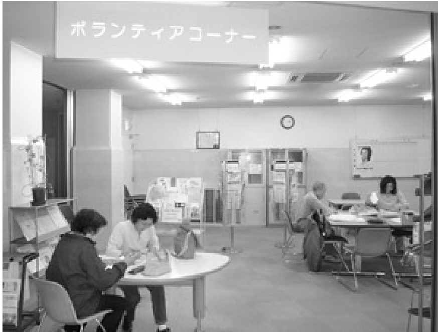
ボランティア活動・情報収集にご活用ください

また、あきる野市内関係機関のパンフレットのほか、ボランティア・NPO・市民活動に関する書籍や他区市町村ボランティアセンターの情報も用意しております。どなたでも閲覧可能ですので、ボランティア活動の情報収集に是非ご利用下さい。