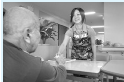
五日市ホームより

小さな赤ちゃんやお年寄り、な かには、様々なハンディキャッ プを持ちながら生活している方 もいます。そのような方が元氣 に、楽しく、幸せに暮らしてい くためには、地域の支えあいが とても大切です。