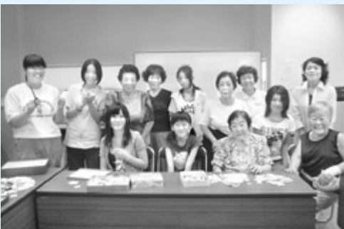
切手整理 すすめの会より

小さな赤ちゃんやお年寄り、な かには、様々なハンディキャッ プを持ちながら生活している方 もいます。そのような方が元氣 に、楽しく、幸せに暮らしてい くためには、地域の支えあいが とても大切です。