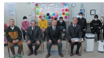
株式会社アイ・シー・エス

空気清浄機や掃除機などを障がい者施設にご寄附いただきました。 ※ご芳名は、181号(令和6年3月号)に掲載しております。