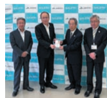
秋川農業協同組合