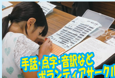
手話・点字・音読など ボランティアサークル