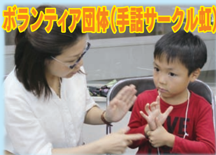
ボランティア団体(手話サークル)