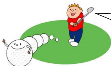
あきる野市民チャリティゴルフ大会